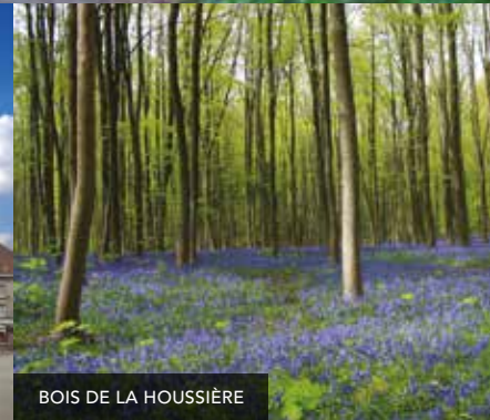
BOIS DE LA HOUSSIÈRE